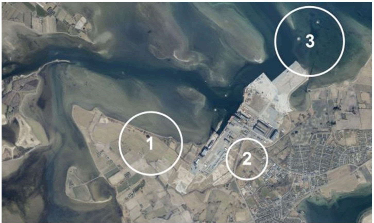
Udviklingsområder - kort med angivelse af fokusnedslag for udvidelse af Odense Havn i Munkebo

Område 2 er igangværende lokalplan 344, som har været i høring og som skal udsendes i fornyet høring. Der forventes politisk behandling af dette på Plan og Teknikudvalgets møde i juni.