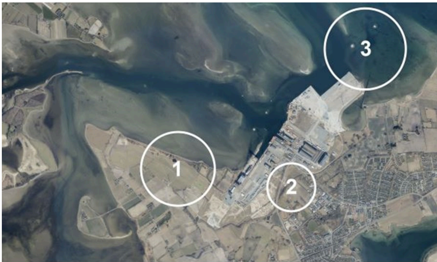
Udviklingsområder - kort med angivelse af fokusnedslag for udvidelse af Odense Havn i Munkebo