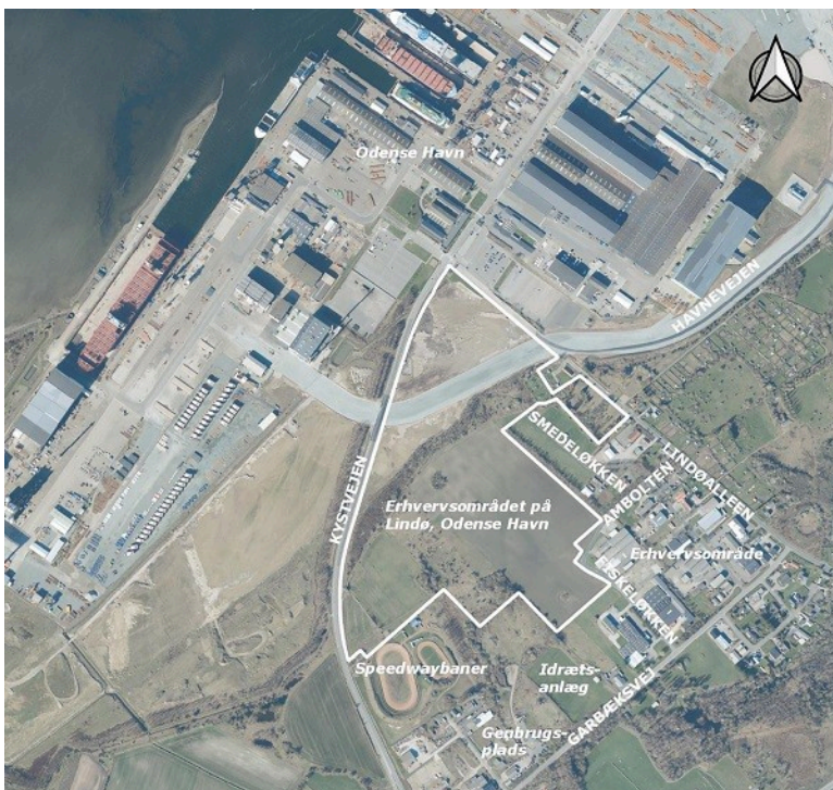
Oversigtskort for nærområdet i tilknytning til lokalplan 344, som er vist med hvid linje.

Forslag til kommuneplantillæg 08 findes her: kerteminde.viewer.dkplan.niras.dk/DKplan/DKplan.aspx?TillaegId=22